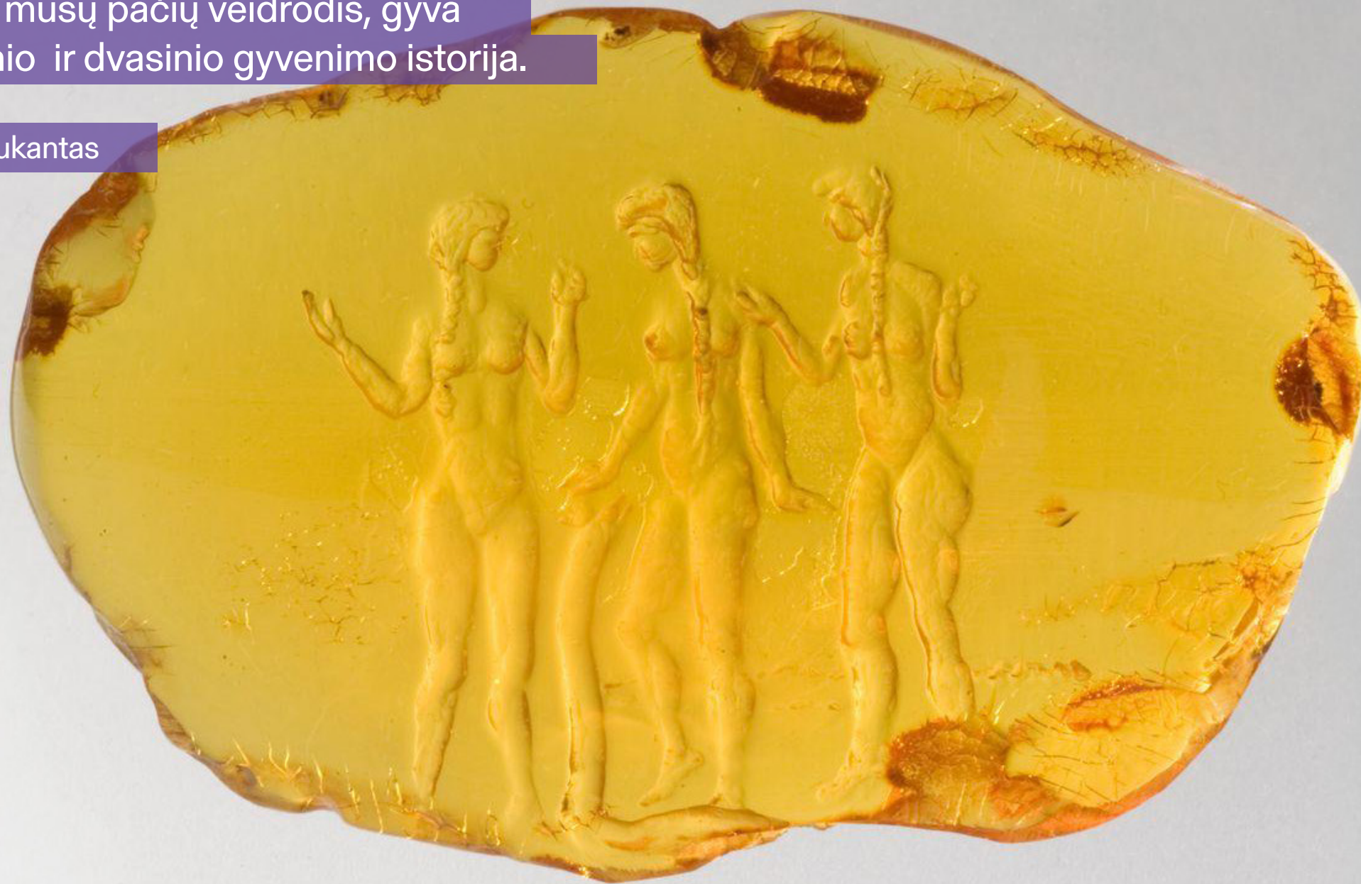
Feliksas Daukantas „Eglė ir seserys“. Lietuvos nacionalinis dailės muziejus