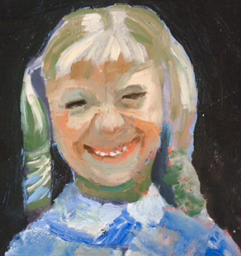
Algimantas Jonas Kuras „Mergaitė“ 1972. Lietuvos nacionalinis dailės muziejus