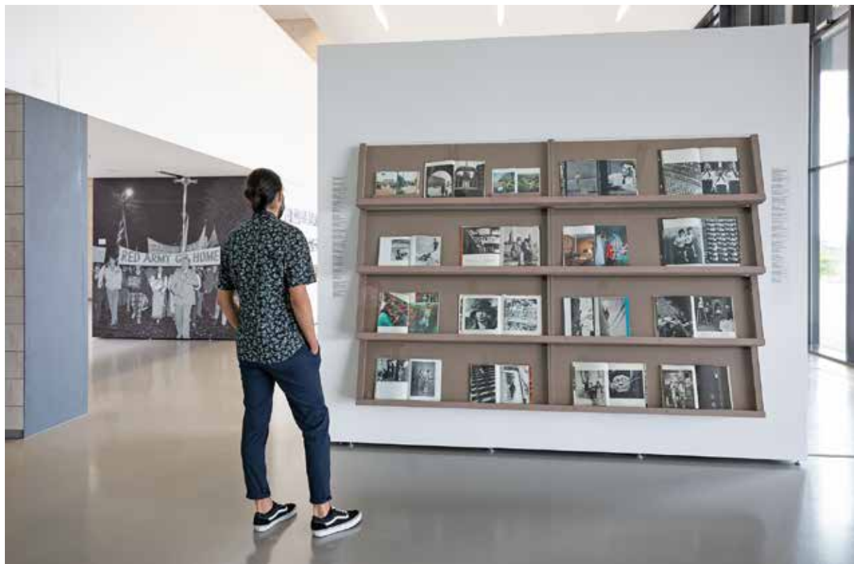
Paroda „Fotoblokas. Centrinė Europa fotoknygose“ Nacionalinėje dailės galerijoje. Ekspozicijos fragmentas. Vilnius, 2021

Trečias parodos skyrius „Naujos valstybės kūrimas“ skirtas propagandai, kuri fotoknygos puslapiuose aptinkama per visą šimtametę jos istoriją. XX a. 3–4 deš. atgavusios nepriklausomybę, kai kuriais atvejais naujai susikūrusios Vidurio Europos šalys dinamiškai kūrė savo tautines tapatybes, dažnai tam tikslui pasitelkdamos šiuolaikinės vizualinės kultūros priemones, tokias kaip brošiūros ir fotoknygos. Tautinė propaganda naudojo avangardistų išvystytą vizualinę retoriką, šlovindama naujus pramonės (ypač 4 deš. pabaigoje) ir karinius laimėjimus. Stiprėjant nacionalistinėms tendencijoms, buvo propaguojami nauji tapatybės naratyvai,