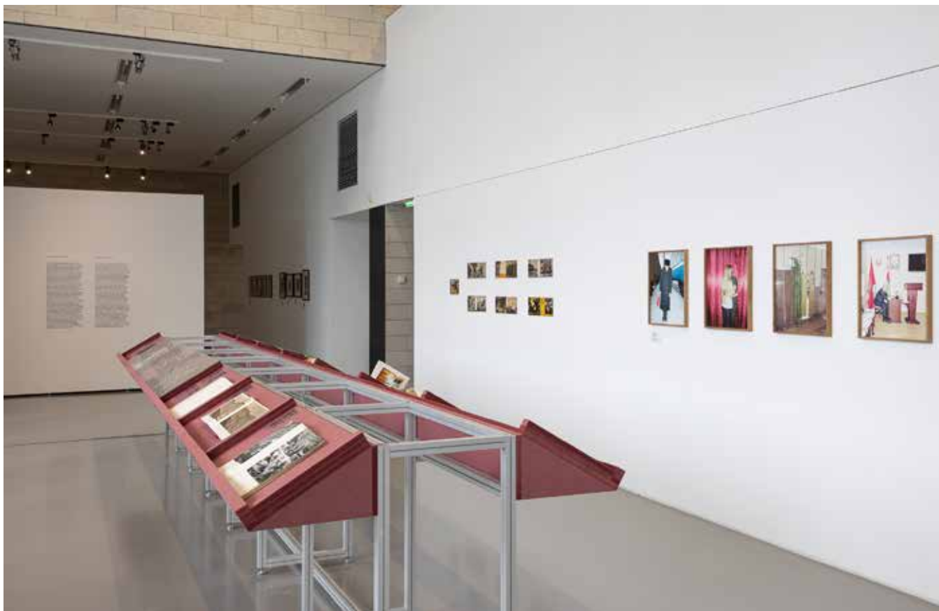
Paroda „Fotoblokas. Centrinė Europa fotoknygose“ Nacionalinėje dailės galerijoje. Ekspozicijos fragmentas. Vilnius, 2021