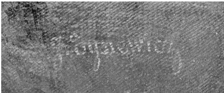
Signatūra „J. Tysiewicz“

Po vizualaus paveikslo įvertinimo, cheminių ir fizikinių tyrimų kūrinyje pradėtas restauruoti. Ištraukus vinutes užlankose, paveikslas buvo nuimtas nuo porėmio. Konstatuota, kad porėmio kryžmos tvirtinimo vietoje vietoj keturių medšraigčių yra išlikę du. Nėra žinoma, ar restauratorius Petras Juodelis, restauruodamas paveikslą 1961 m., nuėmė jį nuo porėmio – restauravimo protokolų knygoje labai lakoniškai parašyta: „7,5 cm 2 , tikslas: išlyginti, nuvalyti, atstatyti, atlikta: išlyginta, nuvalyta, atstatyta, parašas ir data 27/ VIII 61“.