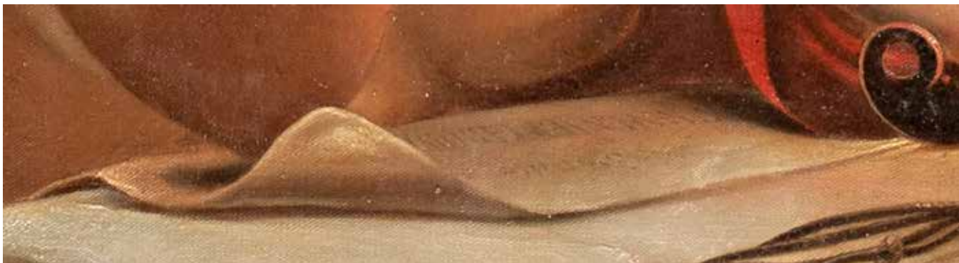
Signatūra „M. W. NIEWIAROWI(CZ)“

drobės užlankos ir priklijuotos „Cekol 700“ klėjais. Paveikslo tapybinis sluoksnis sutvirtintas baltymiais klėjais. Nevaizdinė pusė sutvirtinta supurškiant „Klucel G“ spirito ir distiliuoto vandens tirpalu. Porėmis nuvalytas, dezinfekuotas ir impregnuotas mikrokristaliniu vašku „Cosmoloid H80“. Paveikslas užtemptas ant taip paruošto senojo porėmio. Ankstesnis patamsėjęs retušas paveikslo paviršiuje nuvalytas etilo alkoholiu vatos tamponėliais. Restauraciniu gruntu gruntuoti tapybinio sluoksnio praradimai. Senas lako sluoksnis suplonintas etilo alkoholio, acetono ar etilo alkoholio ir pineno mišiniais. Lako sluoksniui tolygiai suplonėjus, išryškėjo subtilus šiltų ir šaltų spalvų santykis, kuris buvo prislopintas ir suniveluotas pageltusio seno lako. Labiau išryškėjo apimty, erdvės gylis, spalvų sodrumas. Gruntuotos paveikslo vietos retušuotos akvarele. Paveikslas nulakuotas damaros laku.