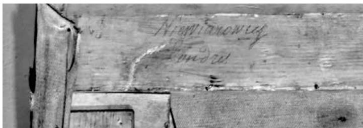
Irašas ant porėmio: „Niewiarowicz Londres“

pataisymų žymes. Šventosios veidas dešinėje pusėje ir apšviestos raudono audeklo dalys švyti kitaip. Tai rodo, kad tose vietose plonintas lako sluoksnis. Fotofiksacija slystančioje šviesoje išryškino pagrindinius paveikslų defektus, ypač atsispaudusius horizontaliosios kryžmos kraštus. Fizikinius tyrimus ir fotofiksaciją atliko restauravimo technologas Tomas Ručys.