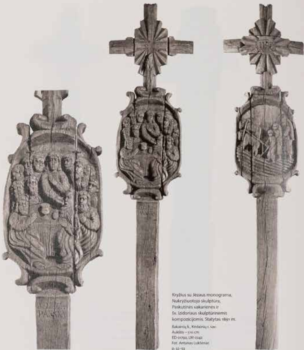
Kryžius su Jėzaus monograma, Nukryžiuotojo skulptūra, Paskutinės vakarienės ir Šv. Izidoriaus skulptūrinėmis kompozicijomis. Statytas 1891 m.

Bakainių k., Kėdainių r. sav. Aukštis – 210 cm ED-21792, LM-2247 p. 51–53