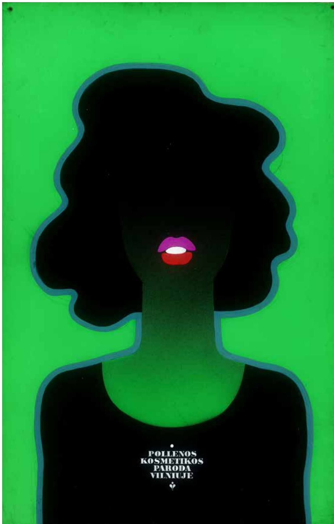
Juozas Galkus. Plakatas „Pollenos kosmetikos paroda Vilniuje“. 1985 Kartonas, gušas, 88 × 57 cm LNDM