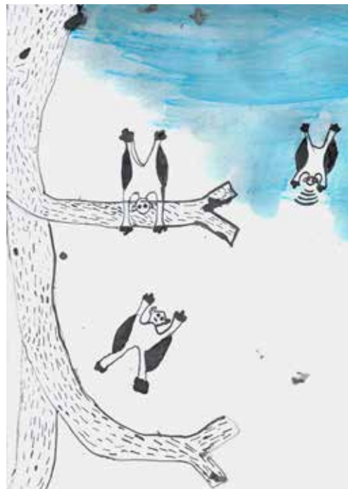
Animacinių dirbtuvių kūrinys Vytauto Kasiulio dailės muziejus, 2019