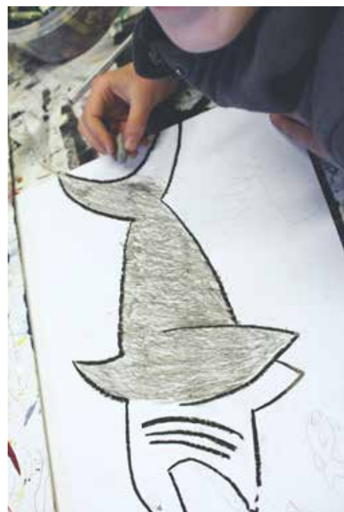
Animacinių dirbtuvių kūrybinis procesas Vytauto Kasiulio dailės muziejus, 2019