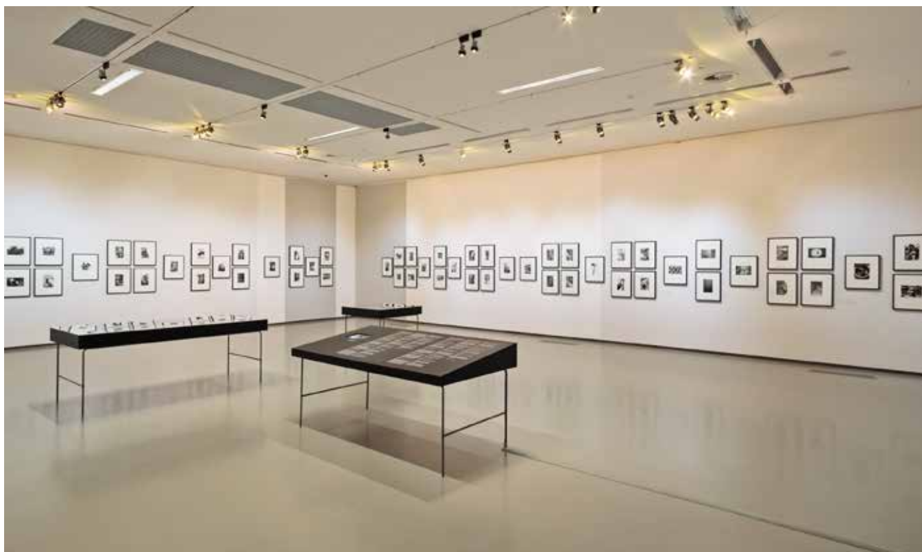
Moišės Ravivo-Vorobeičiko parodos fragmentai Nacionalinė dailės galerija, 2019

Parodoje Vilniuje eksponuotas unikalus artefaktas iš Bauhauzo studijų laikotarpio – tai M. Vorobeičiko diplominio darbo (1929 m.) dokumentinė nuotrauka. Fotografijos centre matyti erdvinė lengvų konstrukcijų skulptūra, liudijanti apie mokymosi pasiekimus ir mokyklos suformuotus pagrindus. Tačiau kartu ji neįprasta ir savo kompozicine sąranga. Nuotraukoje, be paties objekto – bauhauziškos struktūros, – reikšmingą vaidmenį atlieka aplinka, kurioje ši instaliacija eksponuota. Tai studijos erdvės fragmentas, kuriame dominuoja milžiniškas veidrodis. Jame atsispindinti į objektyvo lauką nepatenkanti studijos dalis su fotografu perspektyvinėje gilumoje yra paralelinį nuotraukos siužetą kurianti scena. Taip nuotrauka sukonstruota tarsi su dviem tarpusavyje besivaržančiais naratyviniais centrais. Bauhauzo aplinkoje subrendusiai fotografijos ir kino kalbai būdinga naudoti veidrodžius – jų atspindžiais sukuriama kartotės, įstrižainės, visas šias dinamines kompozicines priemones papildo dažnai naudotas montažo ir koliažo technika. Tokios kompleksinės vaizdą