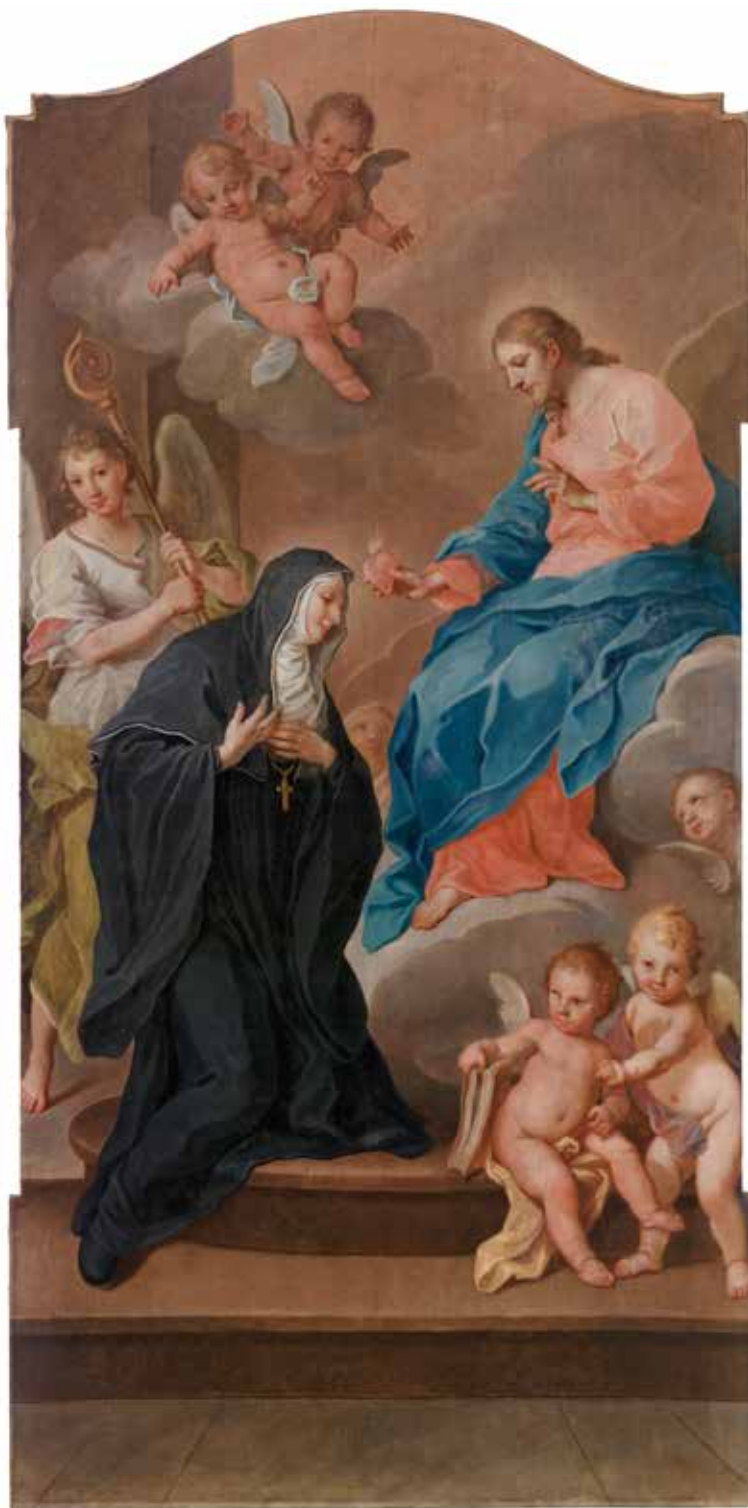
Paveikslas po restauravimo

šv. Matildai, paveikslų kompozicijose. Abi šventosios daug prisidėjo prie Švč. Jėzaus Širdies kulto sklaidos, todėl S. Čechavičiaus tapytuose paveikluose buvo pavaizduotos reginčios viziją, kad Jėzus Kristus joms įteikia meile liepsnojančią savo širdį. Kaip ir kitiems priešpriešais stovėjusiems altoriams, dailininkas pasirinko veidrodines viena kitos atžvilgiu šv. Gertrūdos ir šv. Matildos paveikslų kompozicijas. Vienuoles jis pavaizdavo profiliu, klūpančias priešais Jėzų („Šv. Gertrūda“) ir Švč. Mergelę Mariją su vaikišku Jėzumi („Šv. Matilda“).