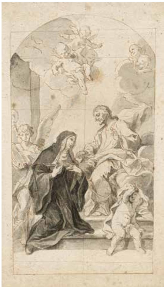
Simonas Čechavičius (1689–1775) Šv. Gertrūda. XVIII a. vid. Popierius, tušas, piešinys, 24,7 × 13,3 cm Nacionalinis M. K. Čiurlionio dailės muziejus, Mg-1839

paveikslas buvo nutapytas ant dvynio pynimo kanapių pluošto drobės, per vidurį vertikaliai susiūtos iš dviejų vienos rūšies audinio gabalų. Ši drobė vidutinio storio, išausta labai retai ( 8 \times 6 siūlai/cm 2 ). Ruošiant drobę tapymui, pirmasis jos įkljinimo sluoksnis buvo atliktas nekokybiškai, todėl didelės audinio akutės neužsipildė klijais – apžiūrint visas paveikslas švietė it rėtis. Daugelyje vietų skylutės buvo pilnos rusvo grunto, kuris kiaurai persisunkė į nevaizdinę paveikslo pusę.