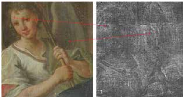
Paveikslo ir rentgenogramos fragmentas, raudonos strėlytės nurodo pertapytas vietas

> Paveikslo fragmentas, apšviestas ultravioletiniais spinduliais, raudonomis strėlytėmis nurodyti tekste paminėti nubėgimai