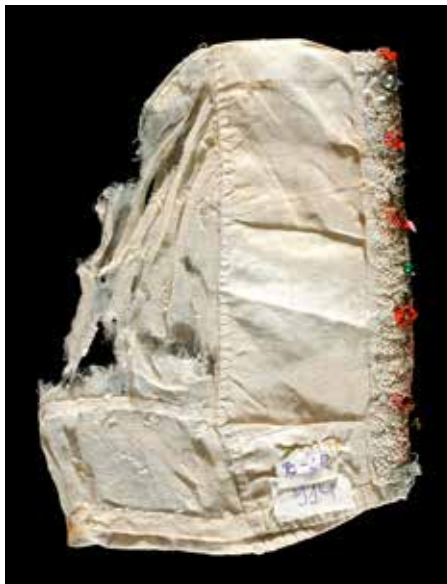
< Kepurėlė prieš restauravimą MKM, GEK-914