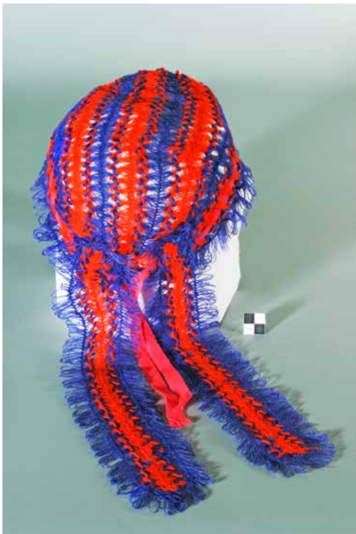
Kepurėlė po restauravimo Anastazijos ir Antano Tamošaičių galerija „Židinys“, Nr. 184