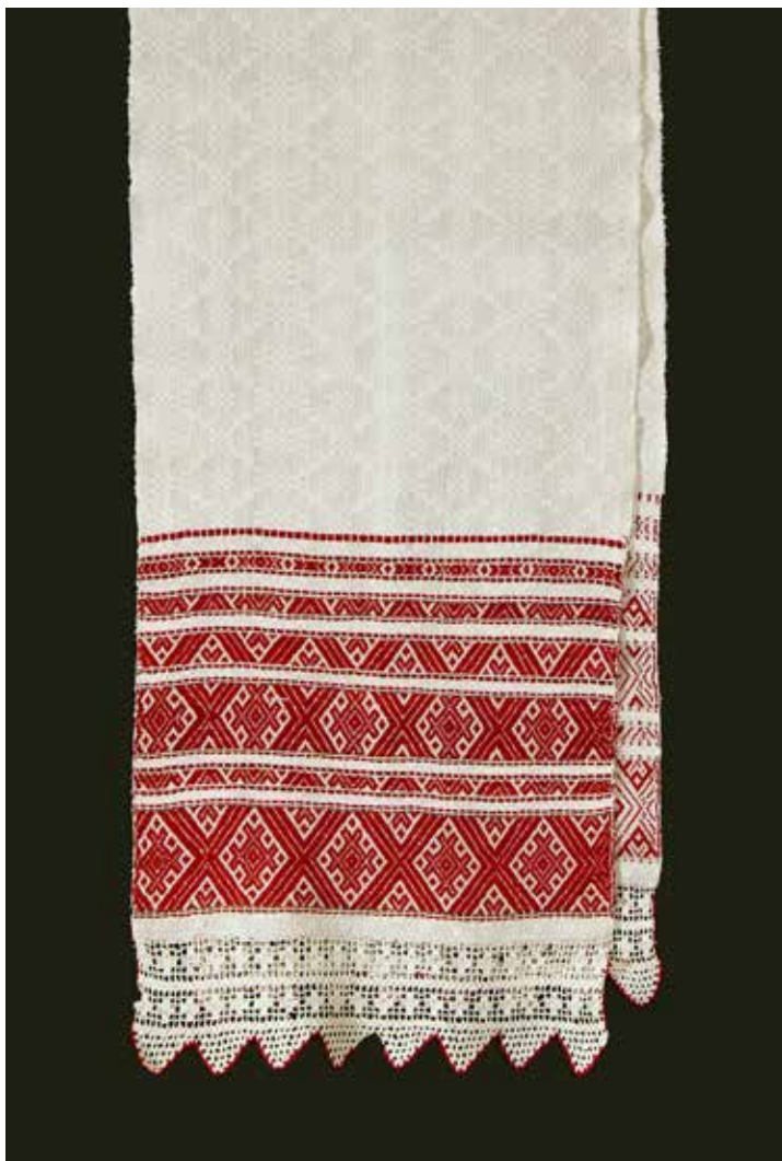
Rankšluostis Jakšičų k., Berežino r., Minsko sr., XX a. pr. Linas, medvilnė; diminis ir rinktinis audimas, nėrimas; 265 × 40 cm BNMA Baltarusių kultūros, kalbos ir literatūros tyrimų centras