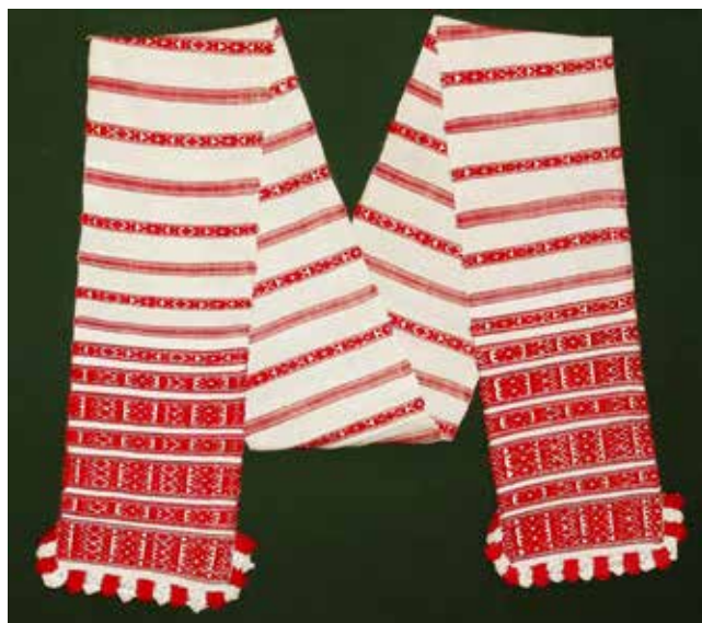
> Rankšluostis Lukų k., Kalinkovičių r., Gomelio sr., apie 1920 Linas, medvilnė; ruoželinis ir rinktinis audimas, nėrimas; 329 × 29 cm BNMA Baltarusių kultūros, kalbos ir literatūros tyrimų centras

naudojami nuo pirmųjų vestuvinių ritualų etapų. Piršliai į merginos namus vykdavo su specialiai tai progai iškepta duona ir degtinės buteliu, įvyniotu į rankšluostį. Jei mergina sutikdavo tekėti, jos motina į išgertos degtinės butelį pripildavo rugių, apvyniodavo savuoju rankšluosčiu ir surišdavo juosta – tai simbolizavo sutikimą tuoktis 5 . Jungtvių metu nuotaka ir jaunikis turėdavo atsistoti ant patiesto rankšluosčio. Kai kuriose Baltarusijos vietovėse ilgai išsilaikė ritualinis nuotakos ir jauniko rišimas apeiginiu rankšluosčiu. Toks rankšluostis vertintas kaip patikimas jaunųjų sveikatos, meilės ir gerovės saugotojas ir laikytas greta poros per visą vestuvių ceremoniją.