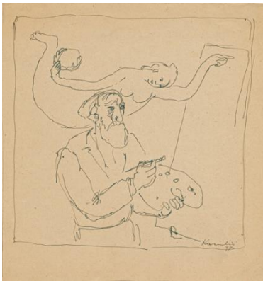
Dailininkas ir mūza. 1947