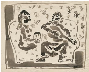
Pora su gitara. XX a. 5 deš.