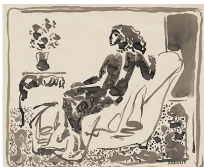
Apsinuoginusi moteris interjere. XX a. 5 deš.