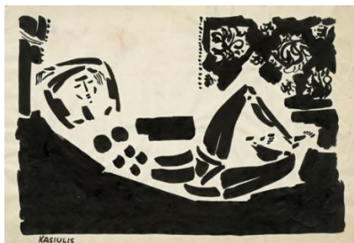
Gulinti moteris. XX a. 5 deš.